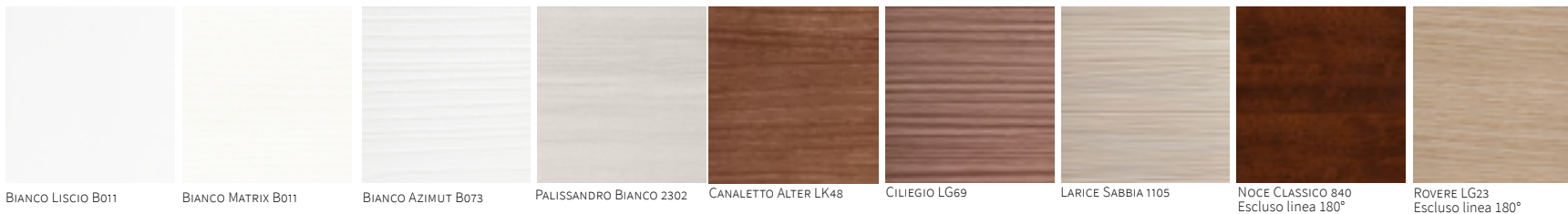
BIANCO LISCIO B011